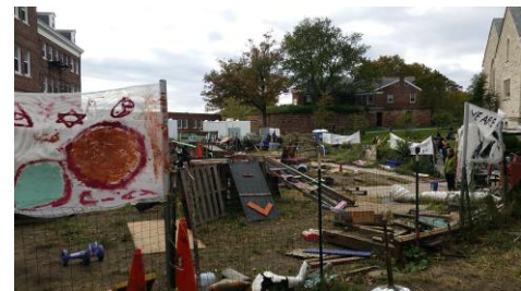
Adventure Playground The Yard in New York

Playwork is een werkwijze om kinderen in hun vrije tijd te begeleiden en te ondersteunen bij het vrije, avontuurlijke en risicovolle spelen. Het komt uit Groot Brittannië waar het ontwikkeld is in de 'adventure playgrounds', en benadrukt het belang van de eigen inbreng van kinderen en hun vrije spel. De 'Playwork benadering' gaat uit van de autonomie van kinderen en de verantwoordelijkheid voor hun eigen speelomgeving en wat zij daar zelf willen spelen. De training Playwork combineert theorie met praktijk aan mensen die werken met kinderen in hun vrije tijd, zoals speeltuinwerkers, pedagogisch medewerkers, sociaal makelaars etc. Zij leren hun werkpraktijk te beschrijven, evalueren en verder ontwikkelen.